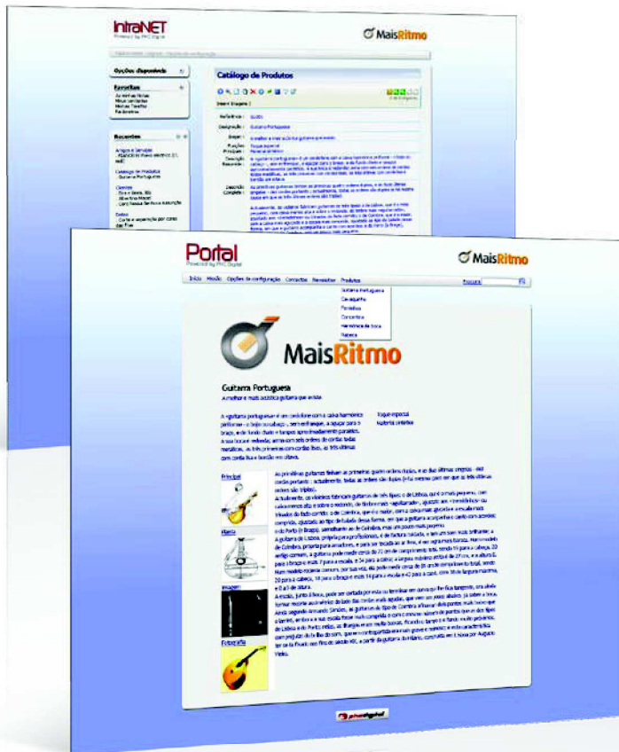
No Catálogo de Produtos pode colocar os artigos ou serviços que pretende vender ou promover no site.

Esta opção permite publicar de forma fácil o que vai acontecendo de relevante na vida institucional da empresa. Pode agrupar as notícias por categorias, dar destaque à notícia no campo resumo, e colocar um headline , que não é mais que o cabeçalho das linhas da notícia.