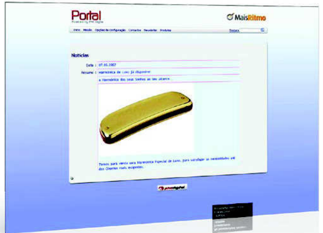
Informe os visitantes do site sobre o que se passa de relevante na vida da empresa.